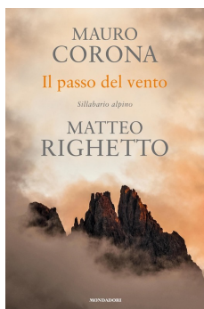
Il passo del vento

Tutto il dolore del mondo, è questo che la vita ha riservato a Ricciardi. Almeno fino a un anno fa. Poi, a dispetto del buonsenso e delle paure, un pezzo di felicità lo ha preso al volo pure lui. Solo che il destino non prevede sconti per chi è condannato dalla nascita a dare compassione ricevendo in cambio sofferenza, e non è dunque su un omicidio qualsiasi che il commissario si trova a indagare nel torrido luglio del 1934. Il morto è l'uomo che per poco non gli ha tolto la speranza di un futuro; il principale sospettato, una donna che lo ha desiderato, e lo desidera ancora, con passione inesauribile. Così, prima di scoprire in modo definitivo se davanti a sé, ad attenderlo, c'è una notte perenne o se ogni giorno arriverà l'alba con le sue promesse, deve ancora una volta, più che mai, affrontare il male. E tentare di ricomporre, per quanto è possibile, ciò che altri hanno spezzato.