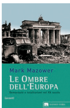
Le ombre dell'Europa