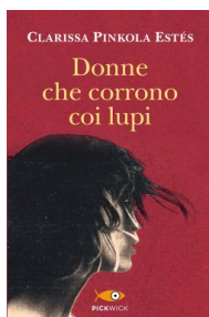
Clarissa Pinkola Estés