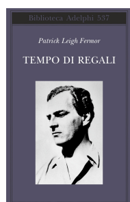
Patrick Leigh Fermor