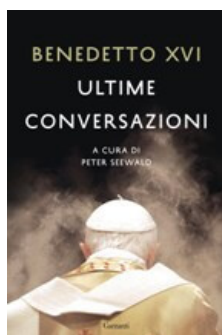
Benedetto XVI e Peter Seewald